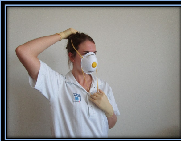
Das obere Band über den Kopf ziehen