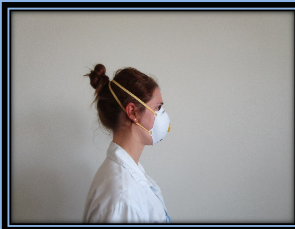
Ein Gummiband unterhalb der Ohren , eines oberhalb der Ohren führen