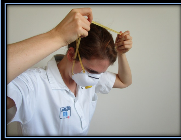
Beim Ablegen: Maske nur an den Gummibändern fassen. Mit vorgebeugtem Körper : Unteres Band über den Kopf ziehen