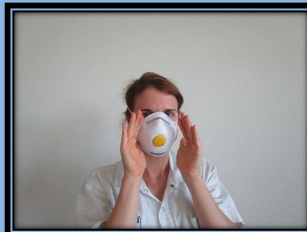
Auf Dichtsitz überprüfen