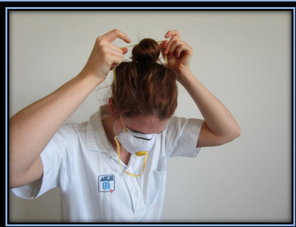
Oberes Band über den Kopf ziehen