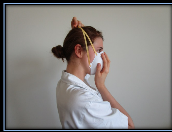
Gummibänder über den Kopf ziehen