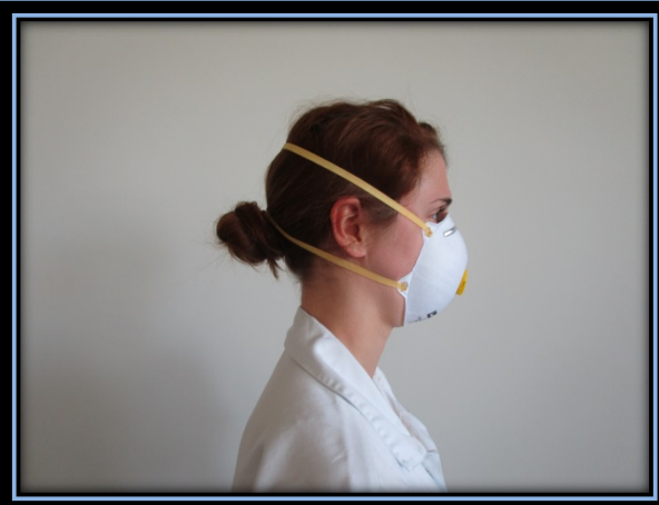
Ein Gummiband unterhalb der Ohren, eines oberhalb der Ohren