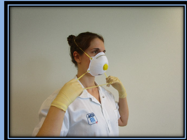
Das untere Band breit aufspannen...