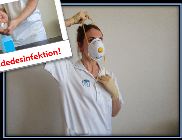
Maske nur an den Bändern nehmen & aufspannen