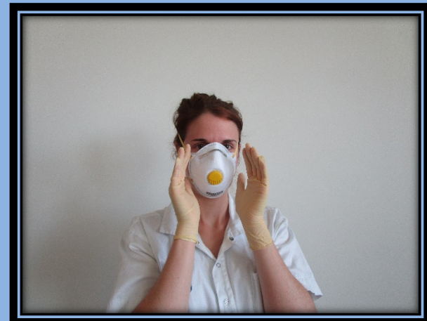
-Nasensteg andrücken und Dichtsitz prüfen -Handschuhe verwerfen