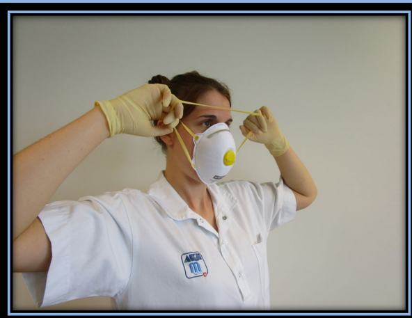
...und vorsichtig über den Kopf ziehen