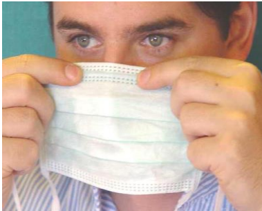
1. Drahtversteiften Rand mittig über der Nase platzieren.