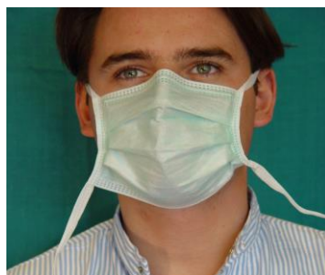
8. ohne Berührung der Maske oberes Halteband seitlich zerreißen und kontaminationsfrei entsorgen