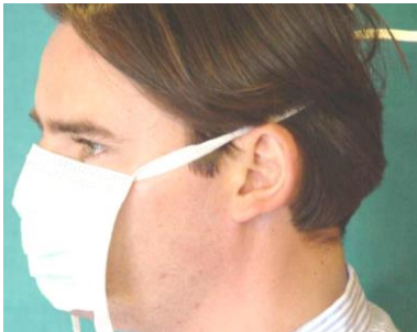
4. richtiger Sitz der oberen Haltebänder