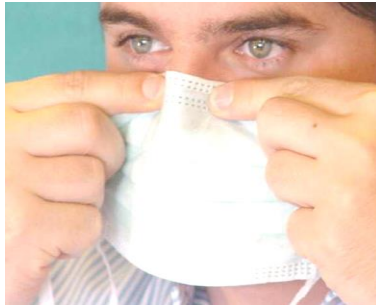
2. an Nasenrücken und Wangen gut anpassen