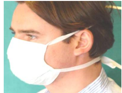
6. untere Haltebänder im Nacken verknoten