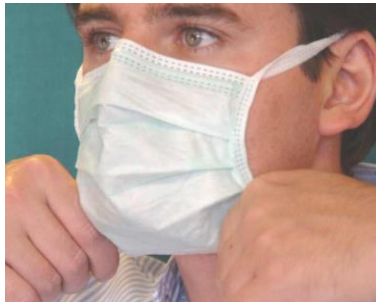
5. Maske über das Kinn zum Hals hin entfalten