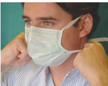
7. ohne Berührung der Maske durch seitlichen Zug die unteren Haltebänder zerreißen