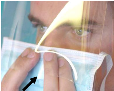
3. an Nasenrücken und Wangen gut anpassen (mit den Fingern unter dem Spritzschuttschild )