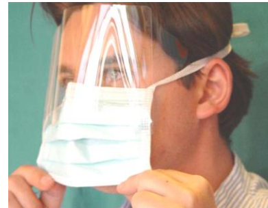
5. Maske über das Kinn zum Hals hin entfalten