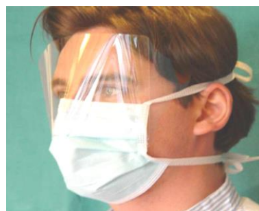
7. richtiger Sitz der Maske