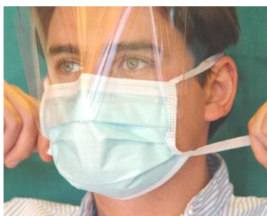
6. untere Haltebänder im Nacken verknoten