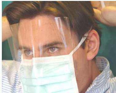
4. obere Haltebänder am Hinterkopf verknoten