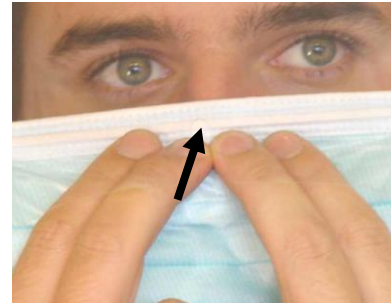
2. Drahtversteiften Rand mittig über dem Nasenrücken platzieren (Ausparung im Spritzschuttschild)